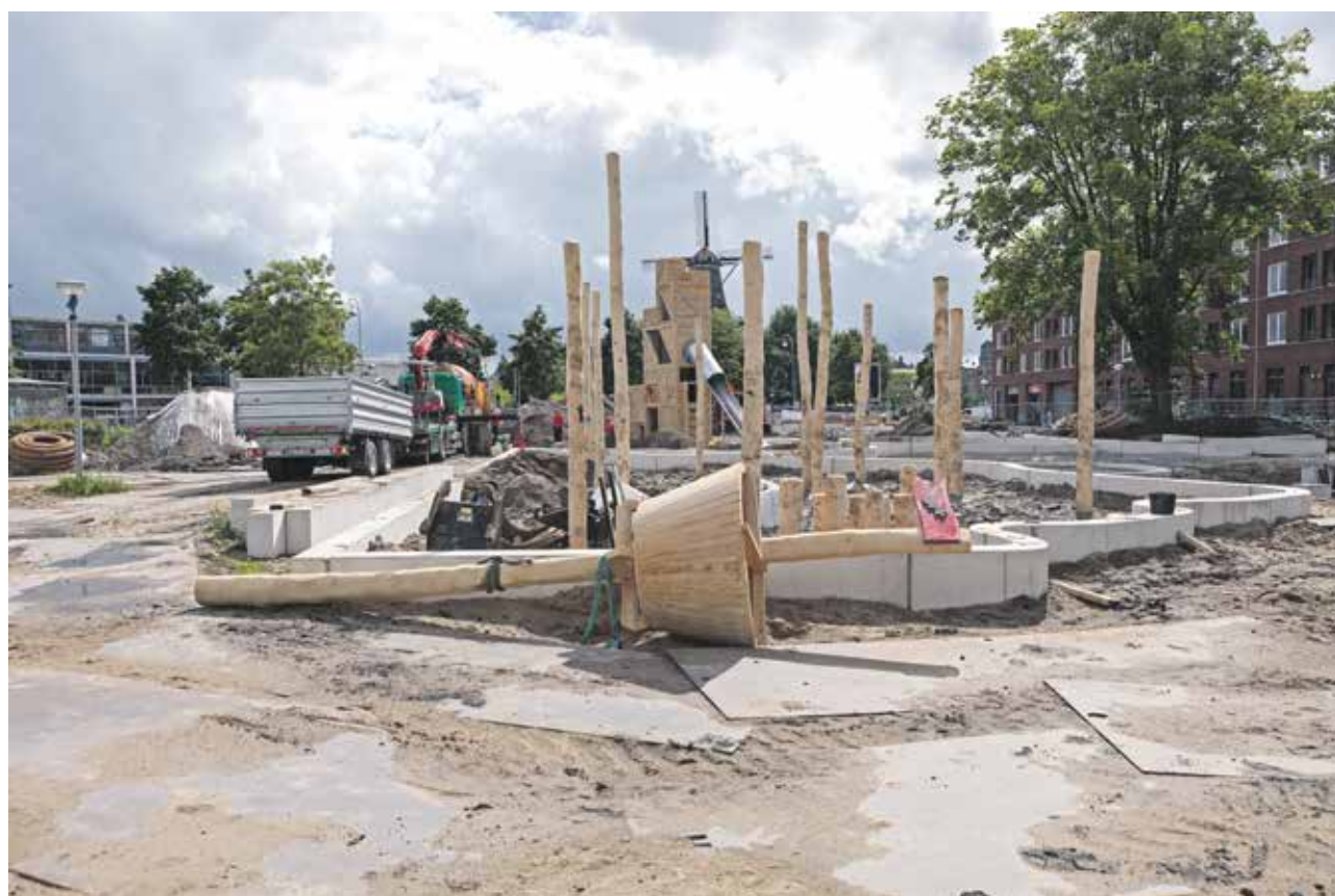
Met de nodige vertraging en na ruim vier maanden bouwen is de nieuwe Oosterspeeltuin aan het Funenpark op woensdag 2 september in gebruik genomen. De komende tijd zal ook het schoolplein van Basisschool Oostelijke Eilanden worden verbouwd.

Wilt u ook een keer met ons uw hond - of ander huisdier - uitlaten? Mail de redactie van 1018: redactie1018@gmail.com