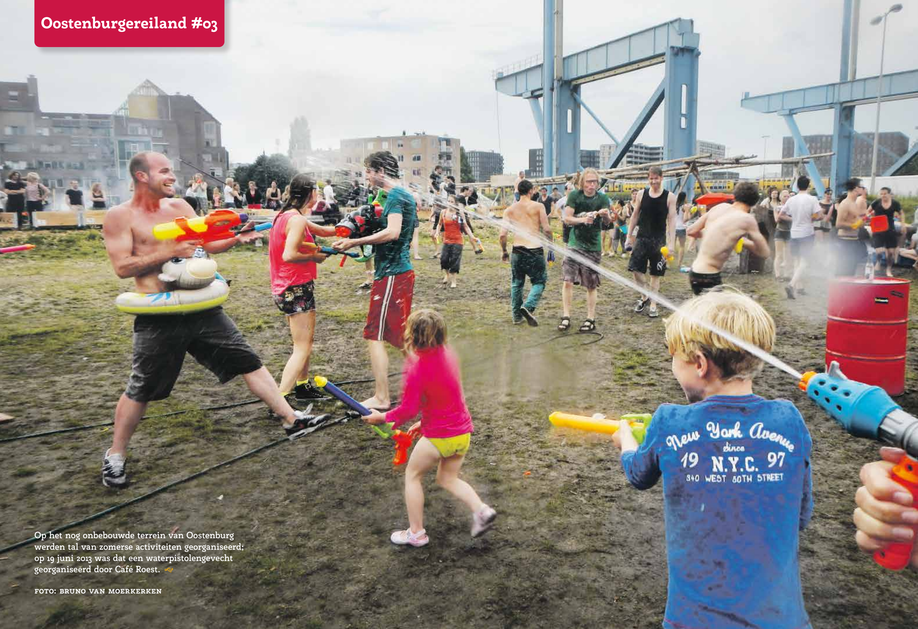
Op het nog onbebouwde terrein van Oostenburg werden tal van zomerse activiteiten georganiseerd; op 19 juni 2013 was dat een waterpistolengevecht georganiseerd door Café Roest. 🍷