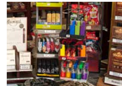
Piet Zeilstra sluit de deuren pagina 23