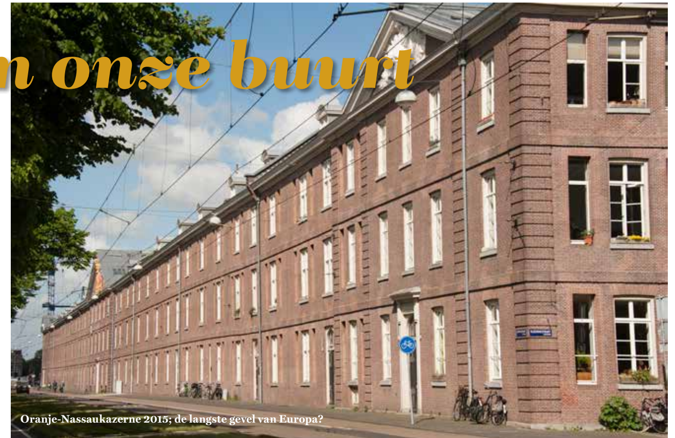
Oranje-Nassaukazerne 2015; de langste gevel van Europa?

De bouw werd gefinancierd door de Amsterdammers zelf. Iedere burger moest 5% van de huurwaarde van zijn woning bijdragen, zo niet, dan was hij verplicht om Franse militairen in huis te nemen. De Fransen droegen niet bij aan de financiering, maar stelden wel steeds hogere eisen, waardoor de kosten van de bouw veel hoger uitkwamen dan was begroot. Toen de kazerne in 1813 was voltooid, was Napoleon inmiddels verslagen en de Franse manschappen zijn er nooit gelegerd geweest. De kazerne werd meteen omgedoopt in Oranje-Nassaukazerne en de Franse symbolen aan de gevels werden in aller ijil vervangen door het wapen van Willem Frederik van Oranje-Nassau, de latere koning Willem I, en afbeeldingen van de Nederlandse Leeuw. Omdat het Koninkrijk der Nederlanden pas in 1814 werd uitgeroepen, is dit het enige openbare gebouw in Nederland waarop het persoonlijke wapen van de vorst staat afgebeeld. De kazerne werd gebouwd in een strenge, sobere