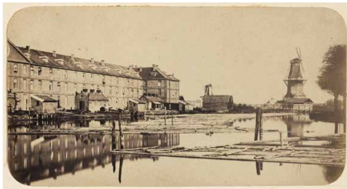
Oranje-Nassaukazerne vanaf de achterkant gezien met zicht op molen de Gooyer en molen De Goede Verwachting, ca. 1854

In 1987 vertrokken de laatste militairen uit de kazerne en werd het gebouw volgens de afspraken overgedragen aan Gemeente Amsterdam, die het complex bestemde voor sociale woningbouw. Toen duidelijk werd dat het gebouw zo'n dertig centimeter was verzakt en renovatie daardoor onbetaalbaar zou worden, besloot de gemeente dat het gebouw maar gesloopt moest worden. Dit ondanks de status van Rijksmonument die het kazerne in 1970 had gekregen. Buurtbewoners protesteerden hiertegen en namen een architectenbureau in de arm dat uitzocht hoe het gebouw wel op een adequate manier behouden zou kunnen blijven. Uiteindelijk is de buitenkant van de kazerne, op een paar kleine wijzigingen na, gespaard gebleven, terwijl de binnenkant geheel is gestript en geschikt is gemaakt voor 182 appartementen en kantoren. In het voormalige bureaubouw bij de vroegere ingang van de kazerne zit nu een blijfvan-mijn-lijfhuus en in het voormalige keukengebouw zit een kinderdagverblijf. Op het voormalige exercitieterrein achter de kazerne verzezen zes woontorens, een gekromd appartementenblok en een L-vormig woonblok. 🏡