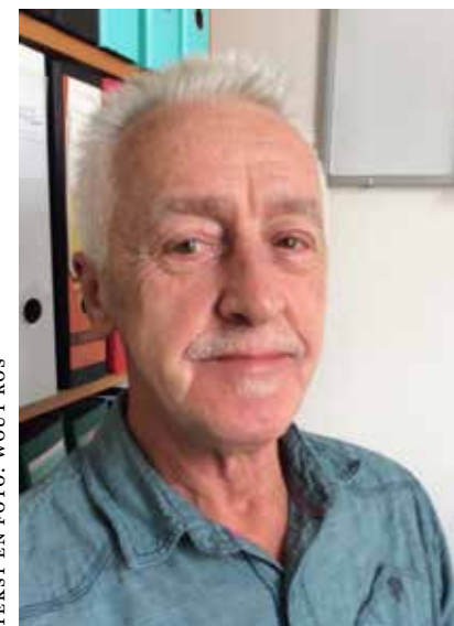
TEKST EN FOTO: WOUT ROS

Kortom, het is de moeite waard om eens langs te komen en te informeren naar de filmactiviteiten. 🐦