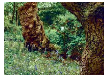
Droom van een hovenier pagina 4