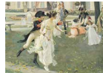
Napoleon terug in 1018 pagina 22