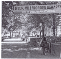
Protesten tegen boomkap in het Weesperplantsoen