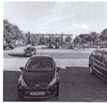
Het Stadionplein blijft het Stadionplein