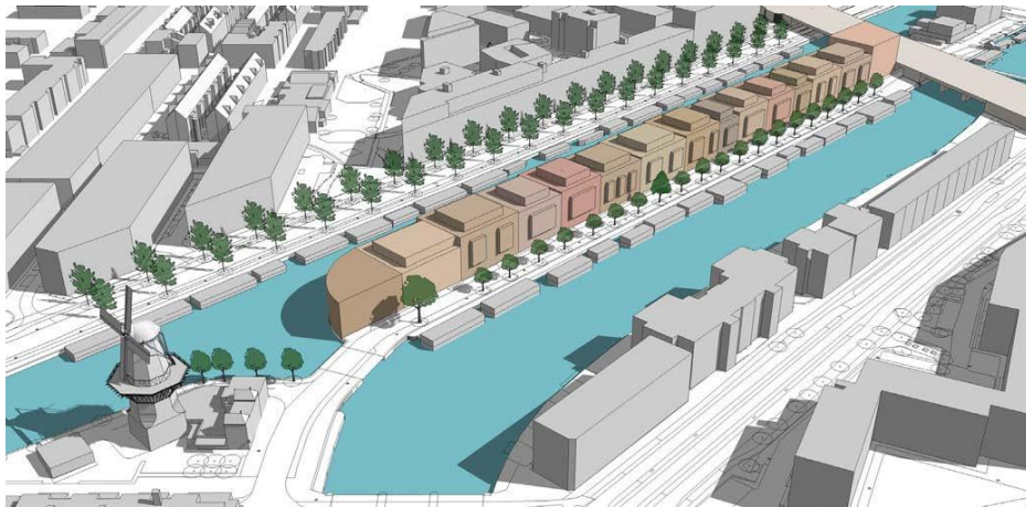
Mogelijk eindbeeld Zeeburgerpad volgens SPvE

Het Stedenbouwkundig programma van Eisen (SPvE) voor het Zeeburgerpad-Centrum ligt ter visie voor inspraakreacties, samen met een nieuw welstandskader. De stukken zijn te raadplegen via http://www.amsterdam.nl/zeeburgerpad/centrum