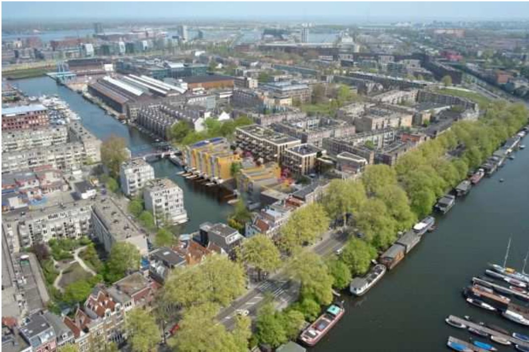
Luchtfoto Wiener & Co