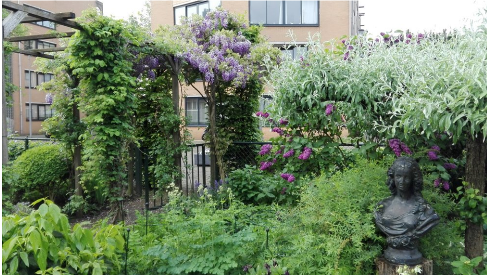
De zelfbeheertuin aan het Windroosplein.

technische en financiële haalbaarheid, kunnen bewoners tussen 19 juni en 19 juli hun stem op een of meer plannen uitbrengen. Nieuw dit jaar is dat zij alleen mogen kiezen uit plannen in hun eigen buurt. Op 24 juli wordt bekend welke voorstellen zullen worden gehonoreerd.