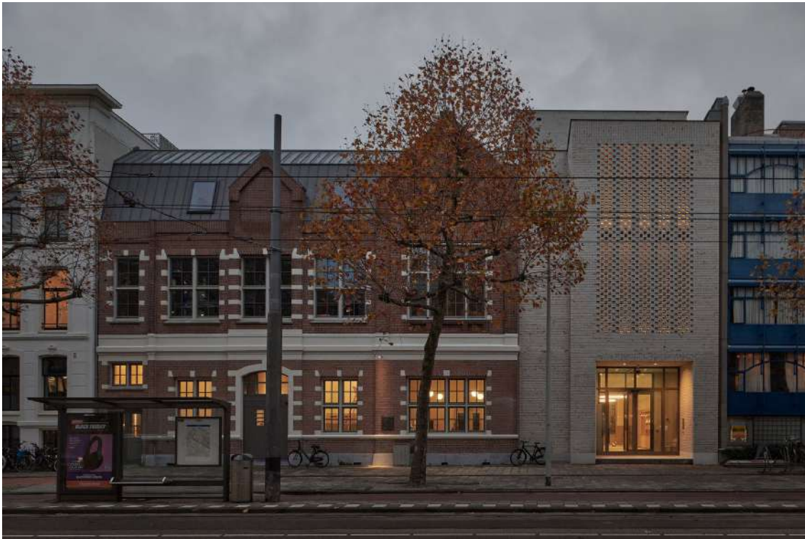
Beeld: MWA Hart Nibbrig

In het museum zullen 2.500 voorwerpen, herontdekte foto's en films, geluidsopnamen, documenten en installaties de geschiedenis vertellen van de Holocaust in Nederland en in de concentratie- en vernietigingskampen in Europa. Maar ook dagelijks leven van Joden voorafgaand aan de Tweede Wereldoorlog, de bevrijding vanuit het perspectief van Joodse Nederlanders en de omgang met de Holocaust in de Nederlandse herinneringscultuur zullen een plek krijgen in het museum.