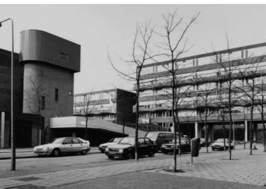
Fotografie: Ino Roël, februari 1990

Een geruststellende Afrikaanse 'bosgeest' is neergedaald boven deze hysterisch schreeuwende reclame langs een druk kruispunt in Amsterdam. Het beeld komt niet terug op het plein. Na een opknopbeurt verhuist Mbulu Ngulu dit najaar naar de overkant waar het, vlakbij de Dageraadsbrug, kan blijven waken over het verkeer.