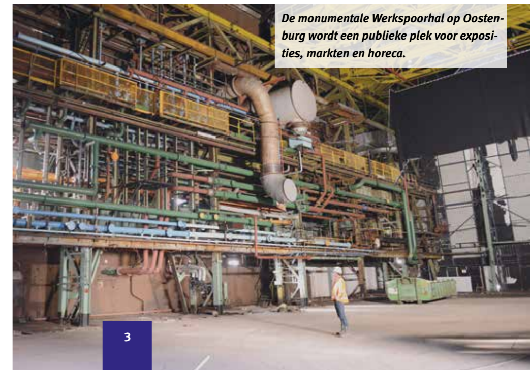
De monumentale Werkspoorhal op Oostenburg wordt een publieke plek voor exposities, markten en horeca.