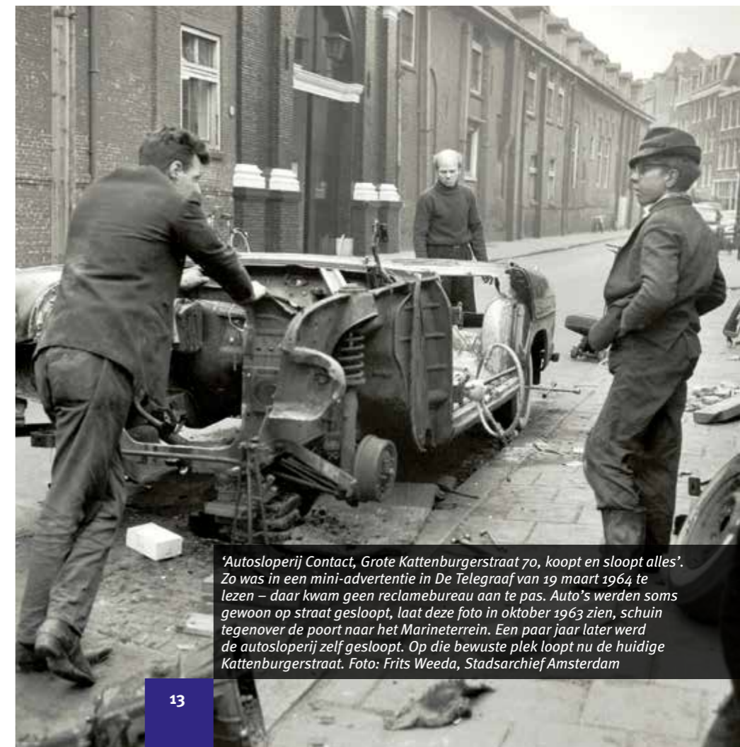
'Autosloperij Contact, Grote Kattenburgerstraat 70, koopt en sloopt alles'. Zo was in een mini-advertentie in De Telegraaf van 19 maart 1964 te lezen – daar kwam geen reclamebureau aan te pas. Auto's werden soms gewoon op straat gesloopt, laat deze foto in oktober 1963 zien, schuin tegenover de poort naar het Marineterrein. Een paar jaar later werd de autosloperij zelf gesloopt. Op die bewuste plek loopt nu de huidige Kattenburgerstraat.

Het is een wens van veel bewoners om van de Kattenburgerstraat een 30km/h straat te maken. Ook de gemeente ziet kansen om de maximumsnelheid in deze straat te verlagen. Momenteel wordt onderzocht wat de mogelijkheden hiervoor zijn. Daarbij is het belangrijk dat automobilisten de maximumsnelheid in de straat herkennen en naleven.